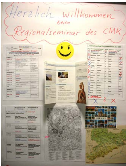
Die beiden Willkommens-Plakate