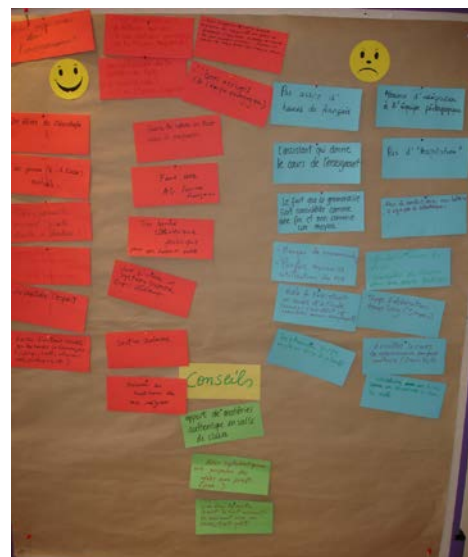
Aufsteller mit Ergebnissen der Gruppenarbeit zum Thema „Erfahrungsaustausch der Assistenten“